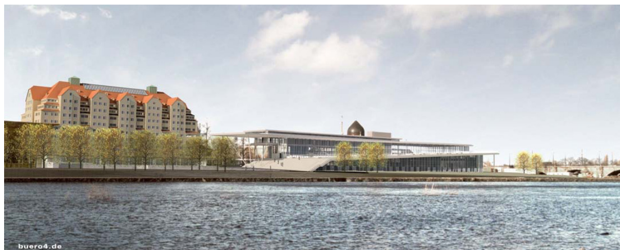
Abbildung (1): Der Tagungsort - Maritim Hotel & Internationales Congress-Center in Dresden

Vom 29.03.2007 bis zum 31.03.2007 stellte der DVV BW den neuen Portaldienst während der Jahreshauptversammlung des Bundesverbandes Deutscher Inkasso-Unternehmen e.V. (BDIU) in Dresden vor. Erwartet wurden ca. 450 Teilnehmer, darunter 140 Inkassounternehmen und 30 Aussteller.