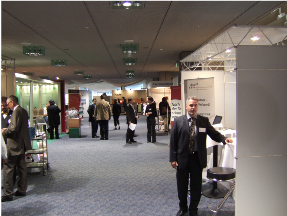
Abbildung (2): Messestand des DVV BW auf der „Advotec 2007“ in Mannheim

Der Datenverarbeitungsverbund Baden-Württemberg präsentierte die Leistungen des dvv.Meldeportals auf der begleitenden Fachausstellung „Advotec 2007“.