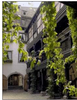
Innenhof des Elsassischen Museums in Straßburg

Im malerischen Innenhof mit seinen dunklen Fachwerkbalken beginnt der Rundgang durch die labyrinthartig aufein-